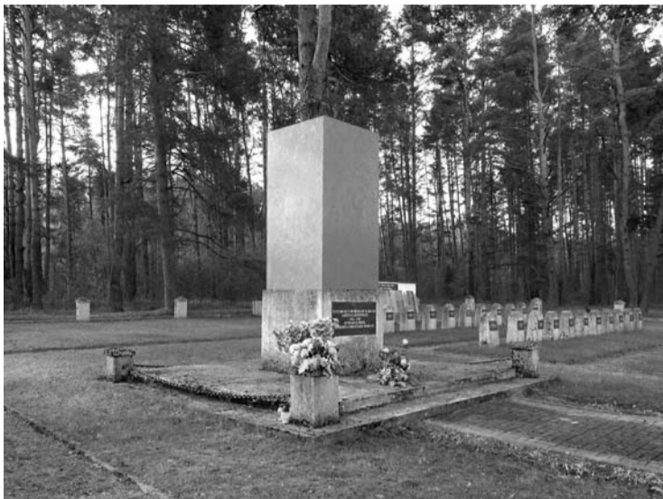
Anykščių sovietinių karių kapinėse esantis paminklas balandžio 29 dieną taip pat paslapčia „aprengtas“ OSB plokštėmis.