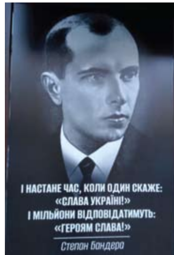
Stepanas Bandera - ukrainiečių kovų už nepriklausomybę simbolis.

uždaužę, bet iš kaimyninių namų pradėję eiti žmonės išgąsdino banditus ir šie pabėgo.