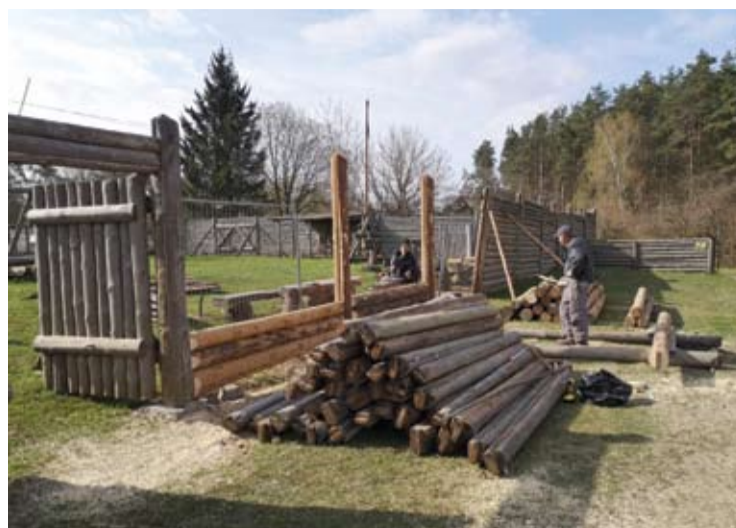
Darbininkai juosia Anykščių muziejui priklausančio edukacinio komplekso, esančio prie Šeimyniškių piliakalnio, tvorą. Kažkur čia muziejus norėtų pastatyti ir trečią bokštą.

Meras sakė, kad Šeimyniškių piliakalniui galėtų pasirūpinti ir Anykščių rajono savivaldybė: „Iš principo mes galėtume skirti pinigus Anykščių regioninio parko direkcijai ir ji viską darytų, nes Šeimyniškių piliakalnis