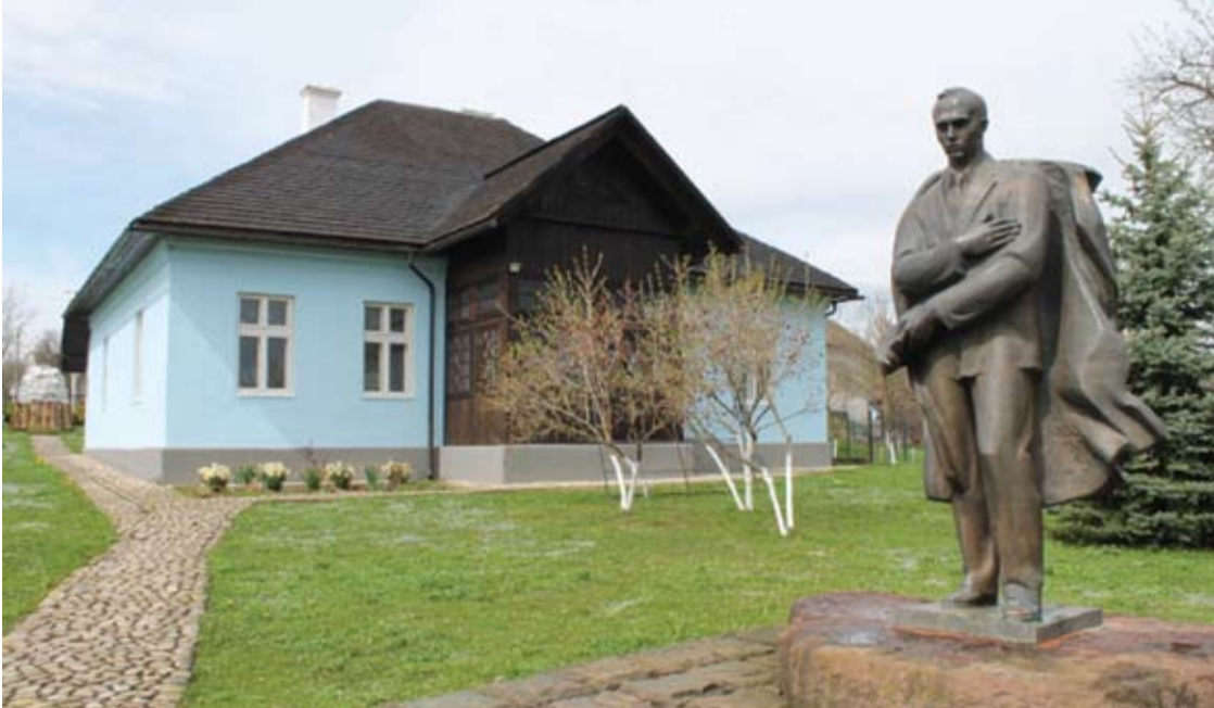
Šis paminklas Stepanui Banderai buvo pastatytas po to, kai teroristai susprogdino pirmąjį paminklą šiam Ukrainos patriotui.

Šie žodžiai daug kam buvo ir yra nesuprantami - kaip galima užpulti kitą valstybę, o jos žmones vadinti fašistais.