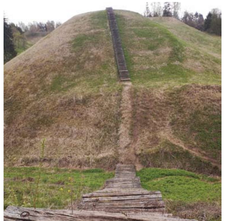
Laiptai per upeliuką, kuriais lankytojai galėjo pereiti į šiaurės vakarinę papilį, sulūžo ir dabar yra nugriauti, todėl apžiūrėti visą Šeimyniškių kompleksą yra sudėtinga.

Susidaro išpūdis, kad šis objektas, nesirealizavus pilies statybos projektui, yra tiesiog paliktas likimo valiai. Tačiau tai yra žinomas Lietuvoje istorijos ir archeologijos paminklas, iki šiol traukiantis turistus. Jo neprižiūra daro gėdą Anykščių kraštui, menkina jo, kaip kurortinės vietovės, įvaizdį ir nuvilia su Lietuvos istorija norinčius susipažinti turistus“, - rašė mokslo darbuotojai.