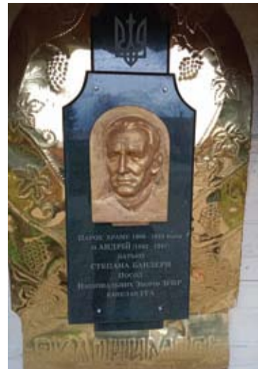
Banderos tėvui skirtas atminimo lenta ant cerkvės sienos.

Žodžius „Slava Ukrainie“ S.Bandera sušuko 1934 metais