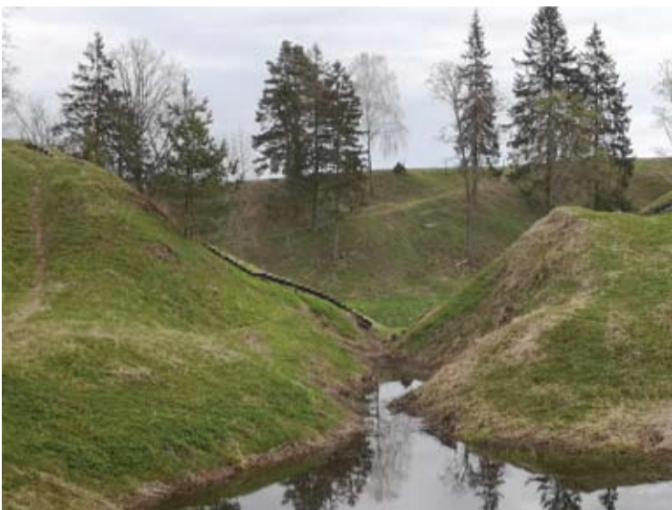
Dalis Šeimyniškių medinių laiptų yra demontuoti, todėl norint apžiūrėti visą piliakalnį lankytojams tenka eiti aplinkui per šlapynes.